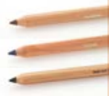
EYE PENCIL BLUE 955