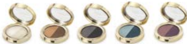
WHITE VANILLA 96151