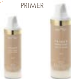
PRIMER UNIFORM EYE BASE 9115