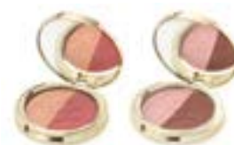
FRESH PEACH LIGHT 9701