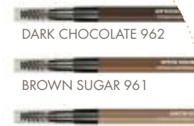
DARK CHOCOLATE 962